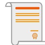
Eskola Kirola ziurtagiria